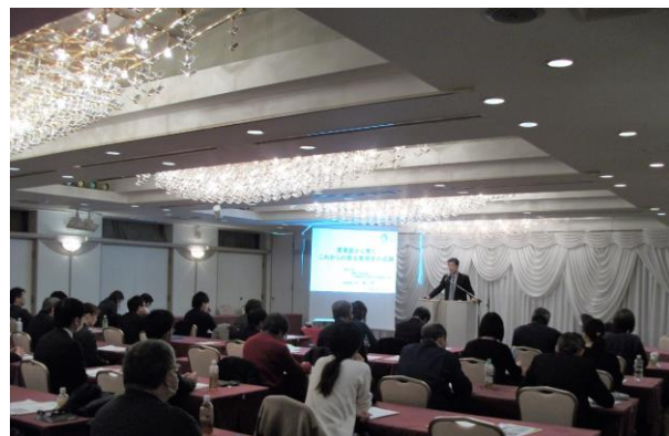
2019年2月5日 研修会 講演「産業医から見たこれからの衛生管理者の役割」