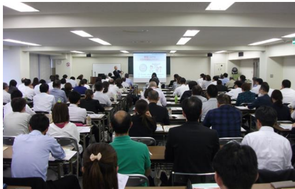
2018年10月5日 研修会 事例報告「受動喫煙防止対策の取組-健康増進法の改正-」

つきましては、貴事業場の衛生管理者、衛生関係スタッフの方々には是非ご入会いただきますようご案内申し上げます。入会金・年会費は無料です。