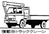
トラッククレーン