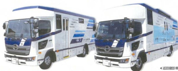
巡回健診車イメージ